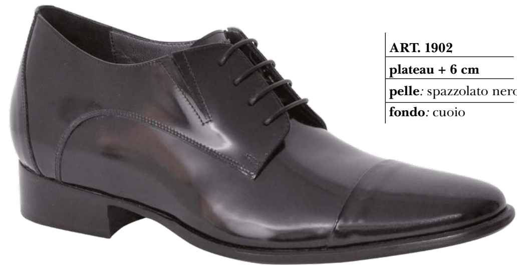
ART. 1902 plateau + 6 cm pelle: spazzolato nero fondo: cuoio