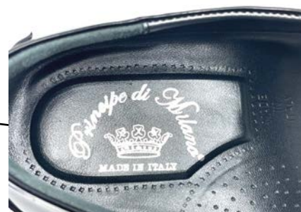
ART. 1361 pelle: spazzolato blu fondo: cuoio