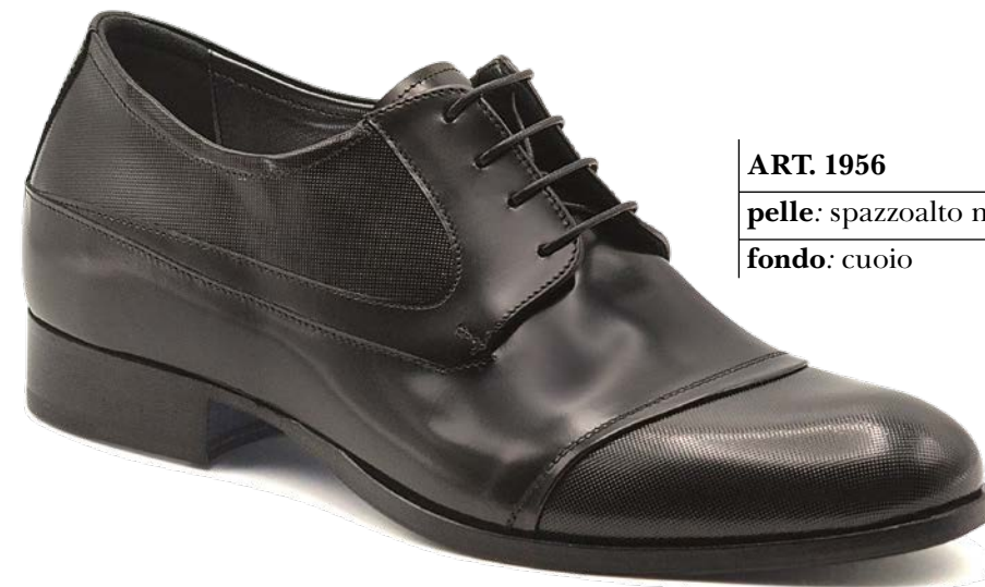
ART. 1956 pelle: spazzoalto nero+puntino nero fondo: cuoio