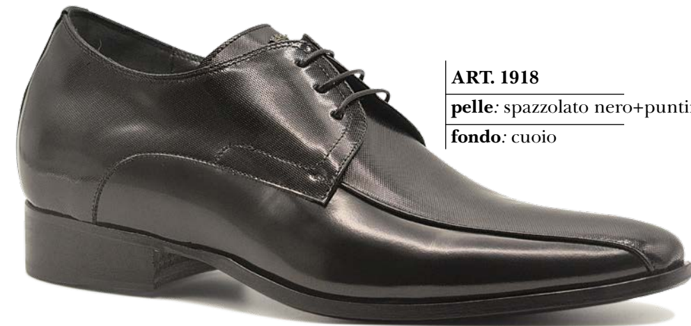
ART. 1918 pelle: spazzolato nero+puntino nero fondo: cuoio