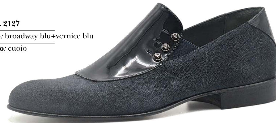
ART. 2127 pelle: broadway blu+vernice blu fondo: cuoio