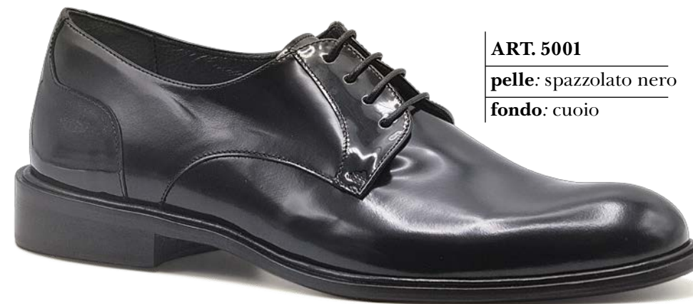
ART. 5001 pelle: spazzolato nero fondo: cuoio