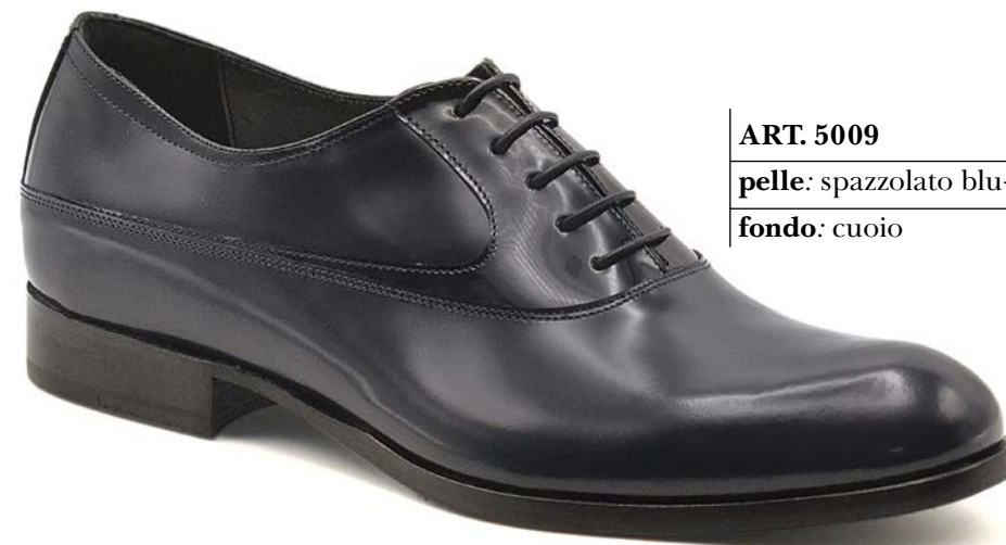
ART. 5009 pelle: spazzolato blu+vernice blu fondo: cuoio