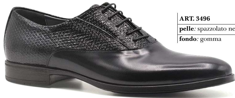
ART. 3496 pelle: spazzolato nero+trial nero fondo: gomma