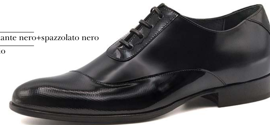
ART. 1717 pelle: diamante nero+spazzolato nero fondo: cuoio