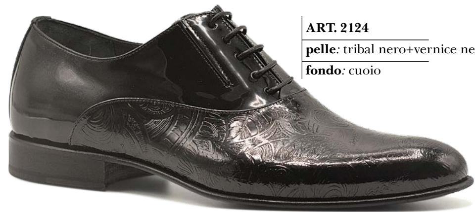
ART. 2124 pelle: tribal nero+vernice nero fondo: cuoio