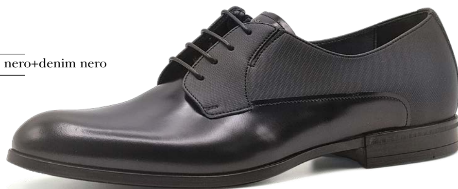
ART. 8013 pelle: spazzolato nero+denim nero fondo: gomma