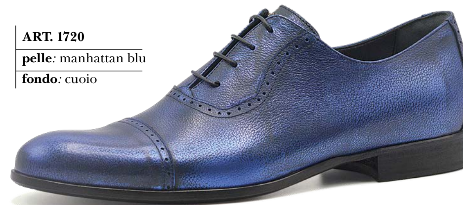
ART. 1720 pelle: manhattan blu fondo: cuoio