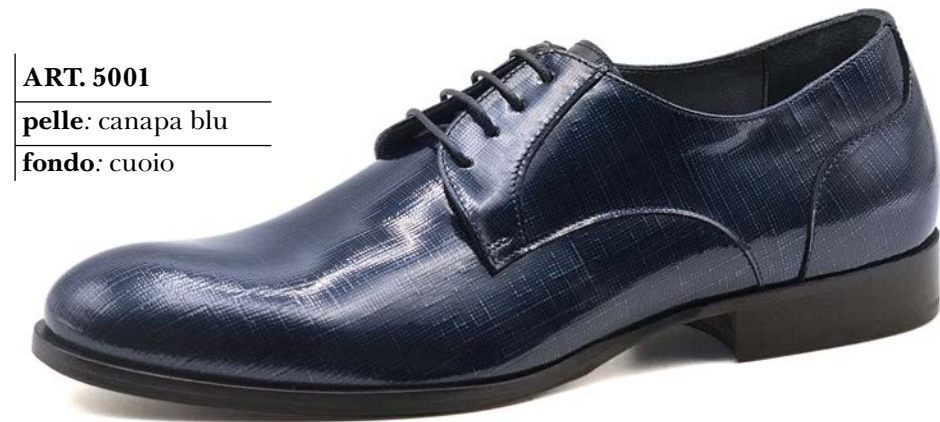
ART. 5001 pelle: canapa blu fondo: cuoio