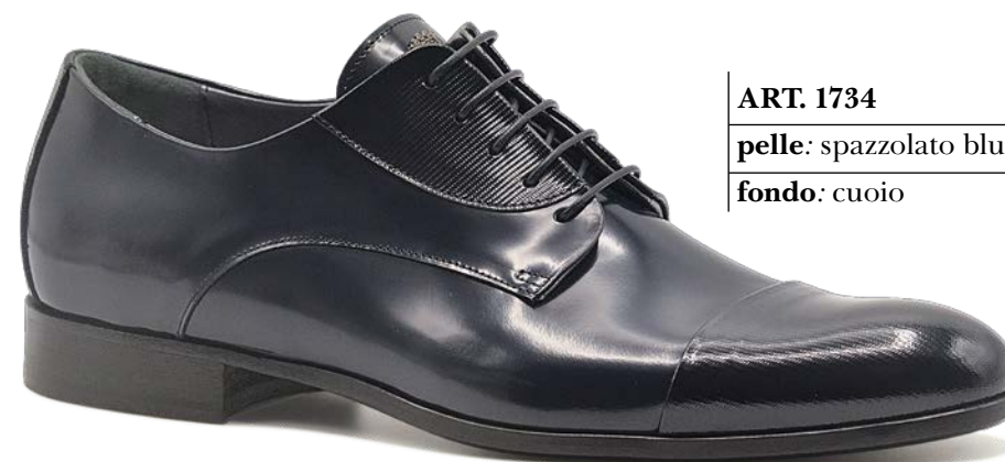
ART. 1734 pelle: spazzolato blu+vegas blu fondo: cuoio