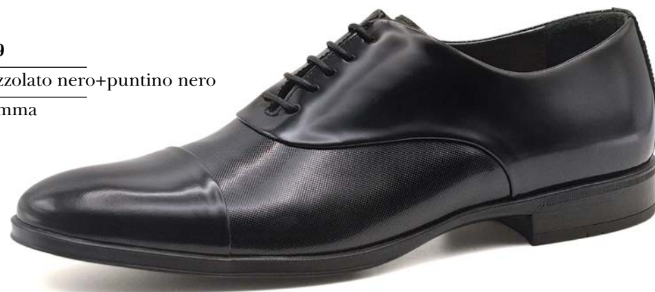
ART. 3629 pelle: spazzolato nero+puntino nero fondo: gomma