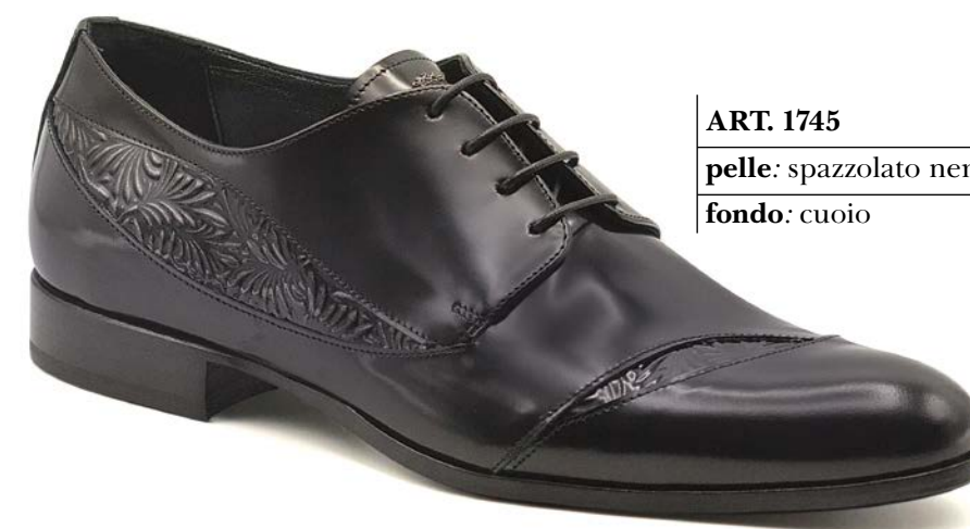
ART. 1745 pelle: spazzolato nero+sole nero fondo: cuoio