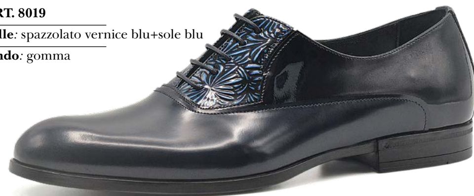
ART. 8019 pelle: spazzolato vernice blu+sole blu fondo: gomma