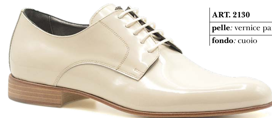
ART. 2130 pelle: vernice panna fondo: cuoio