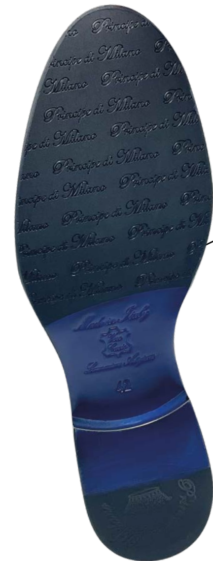
SUOLA CUIOIO CON INSERTI ANTISCIVOLO