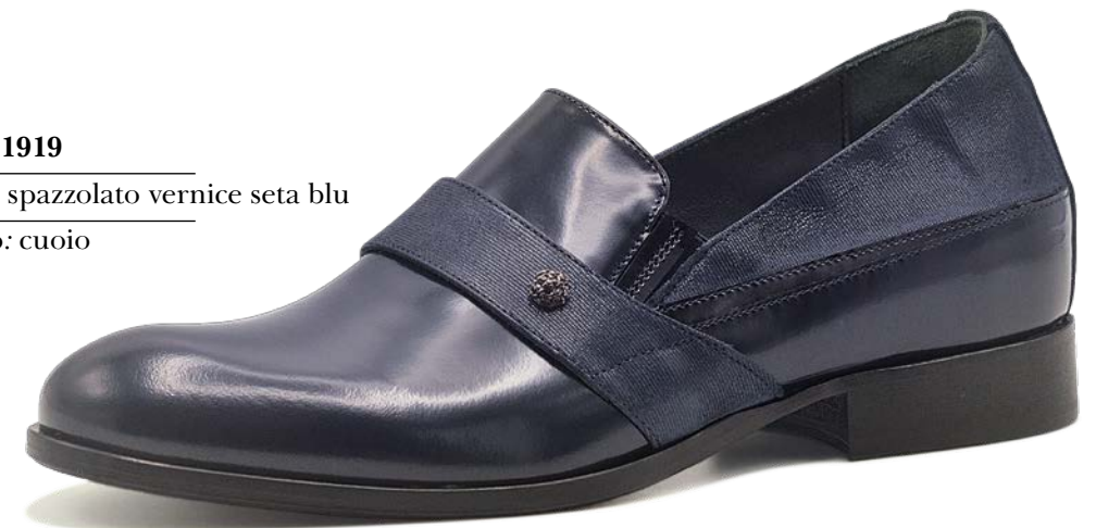
ART. 1919 pelle: spazzolato vernice seta blu fondo: cuoio