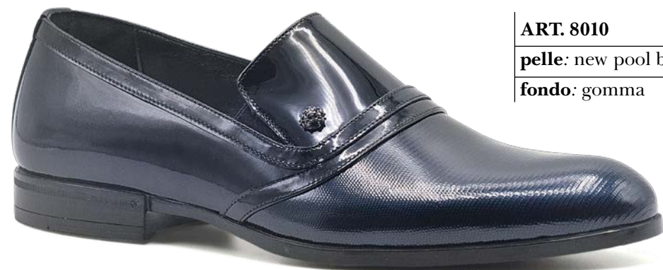
ART. 8010 pelle: new pool blu+vernice blu fondo: gomma

RIALZO INTERNO + TACCO ESTERNO MAGGIORATO