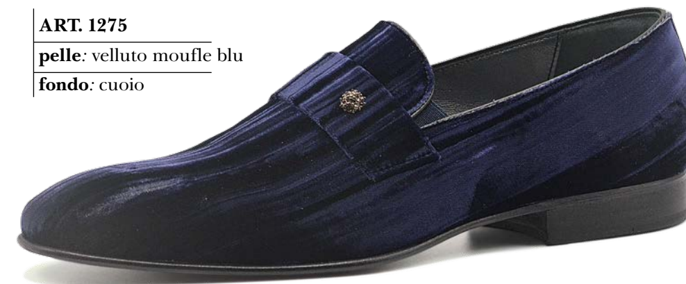
ART. 1275 pelle: velluto moufle blu fondo: cuoio