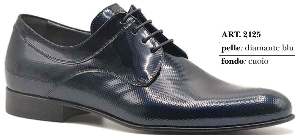
ART. 2125 pelle: diamante blu fondo: cuoio