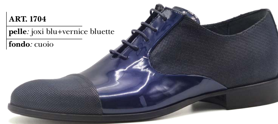
ART. 1704 pelle: joxi blu+vernice bluette fondo: cuoio