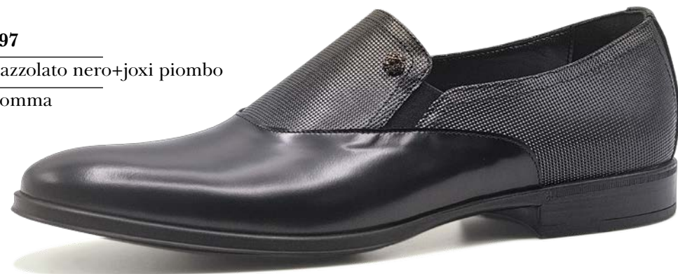
ART. 3497 pelle: spazzolato nero+joxi piombo fondo: gomma