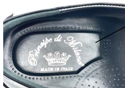
PLANTARE ANATOMICO INTERNO