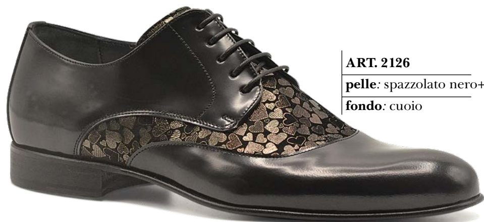
ART. 2126 pelle: spazzolato nero+cuoio piombo fondo: cuoio