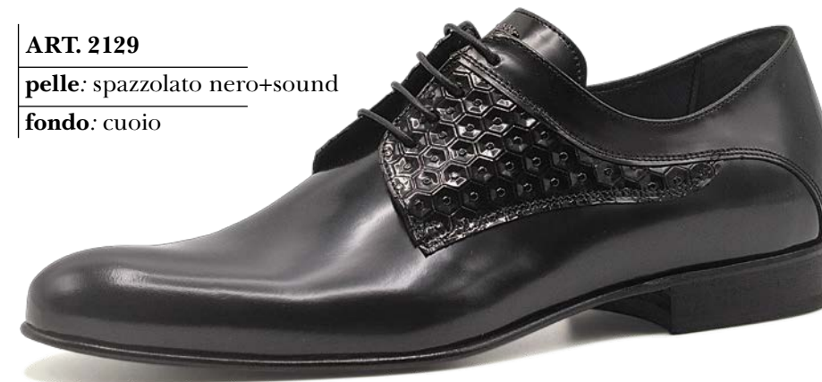
ART. 2129 pelle: spazzolato nero+sound fondo: cuoio