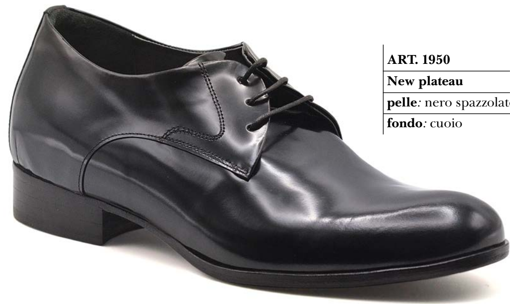
ART. 1950 New plateau pelle: nero spazzolato fondo: cuoio