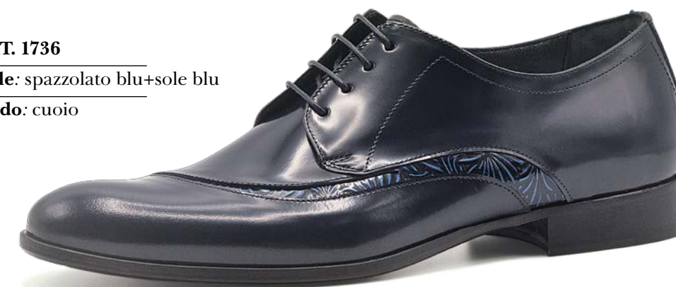
ART. 1736 pelle: spazzolato blu+sole blu fondo: cuoio